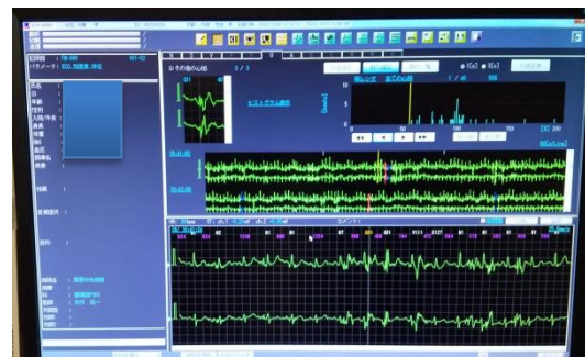
ホルター心電図解析