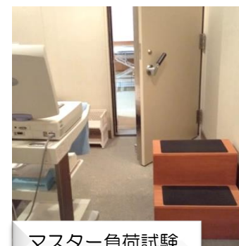
マスター負荷試験